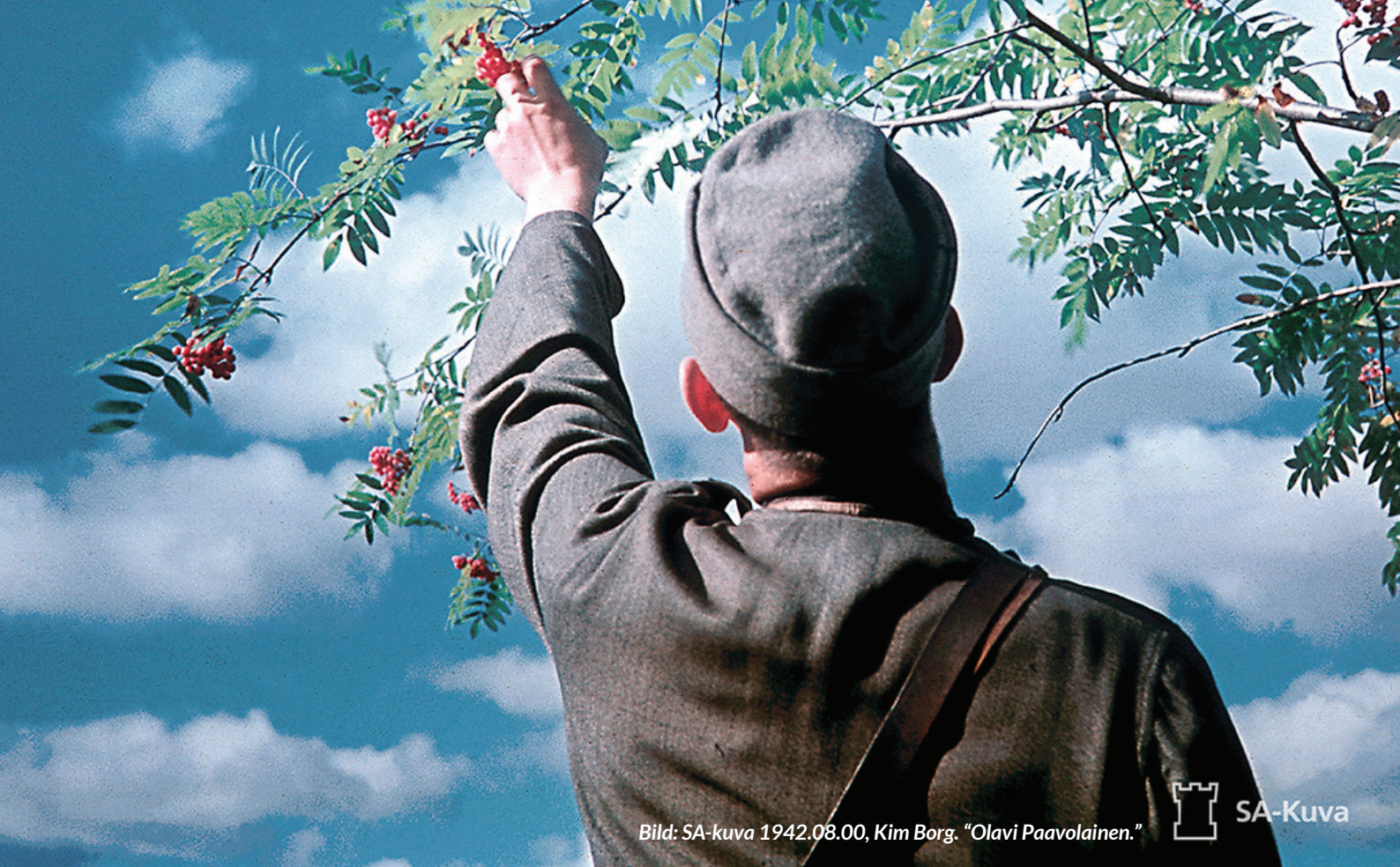
"Olavi Paavolainen."